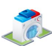
Магазины бытовой техники