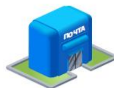
Отделения почтовой связи

Всю дополнительную необходимую информацию о телевизионном вещании в Алтайском крае Вы также можете получить по телефонам: 8 (3852) 50-64-98 – центр консультационной поддержки Алтайского филиала РТРС